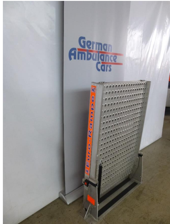
Standard Rampe 2,40 m x 0,70 m Art.Nr. H20104 Tragfähigkeit 300 kg